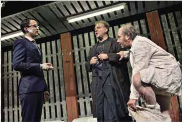
Württembergische Landesbühne Esslingen

IM RAHMEN DES SÜSSENER KULTUR- FRÜHLINGS